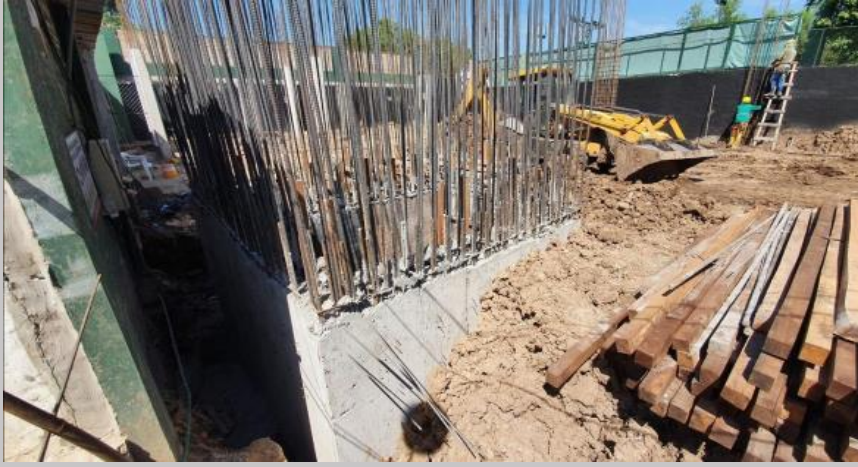
Sector ya hormigonado con sus arranques correspondientes para el siguiente tramo