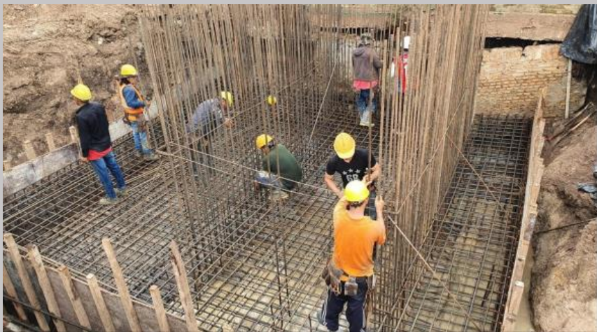
Armado de la planta de fundación y tabiques de caja de escalera y ascensor