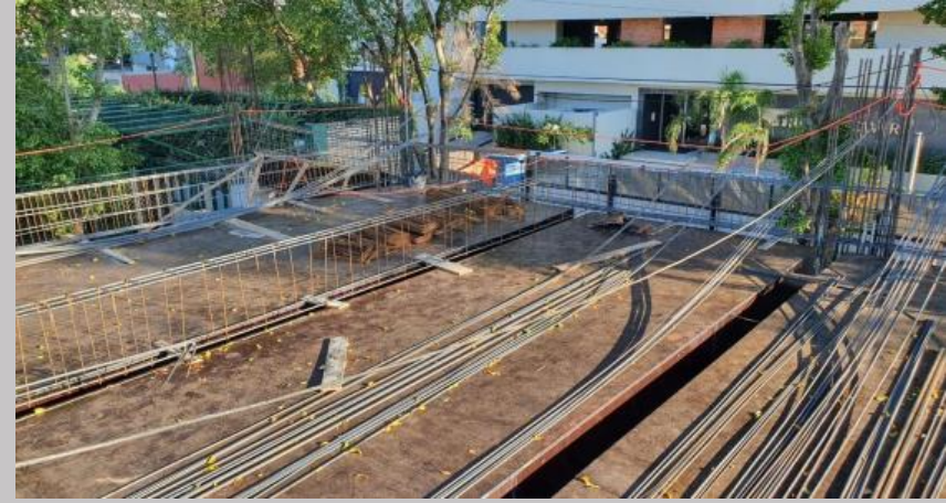
Armadura de vigas y losas del techo planta baja en esta primera etapa de carga