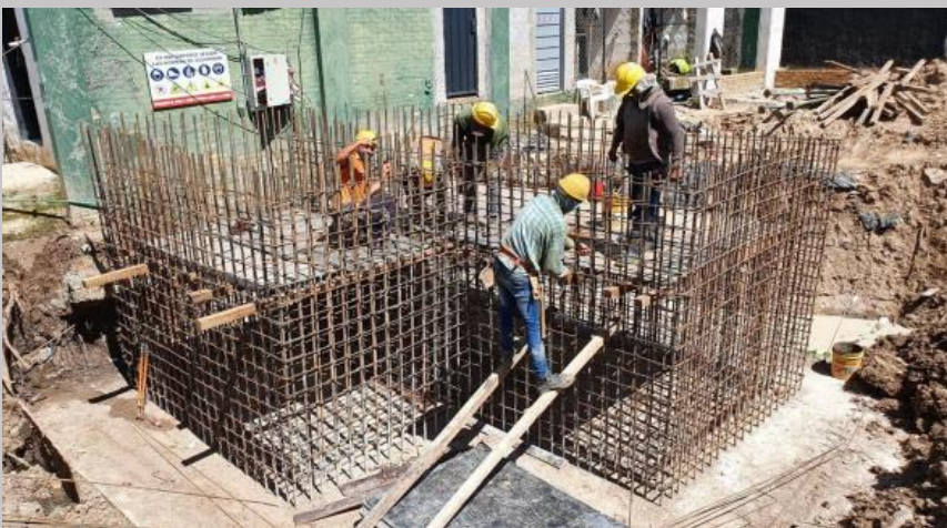
Ya sobre la fundación hormigonada se prepara la siguiente etapa hasta nivel PB