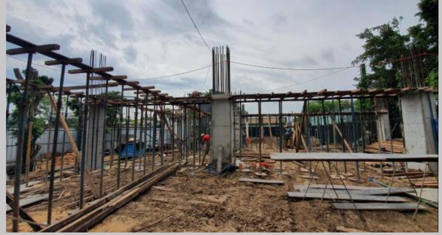
Inicios de los trabajos de fondo de vigas para el encofrado de la primera losa