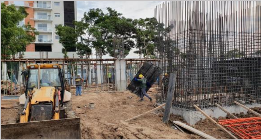
Al fondo el avance en el encofrado para la primera etapa de carga del techo de PB