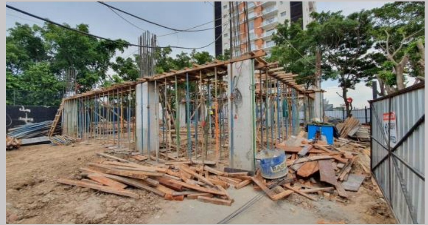
Encofrado de los fondos de vigas de este primer sector