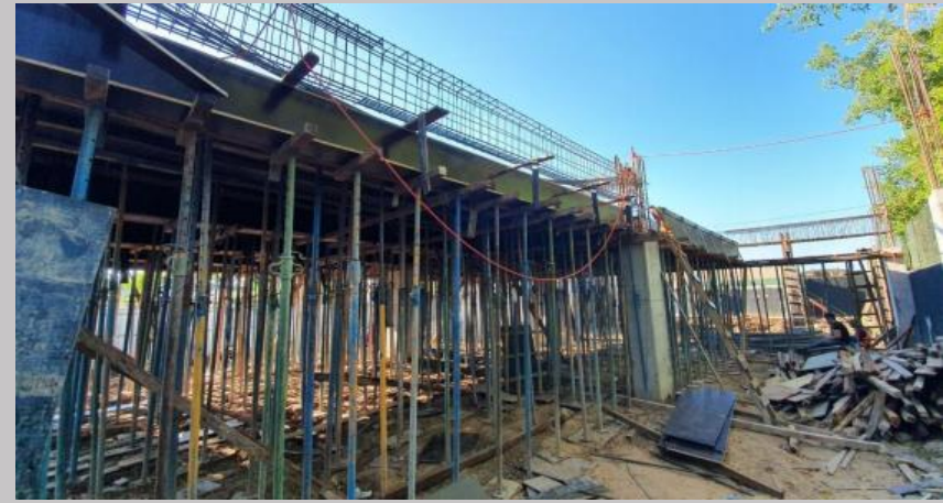
Una vista desde el sector de la subida de la rampa al estacionamiento E1