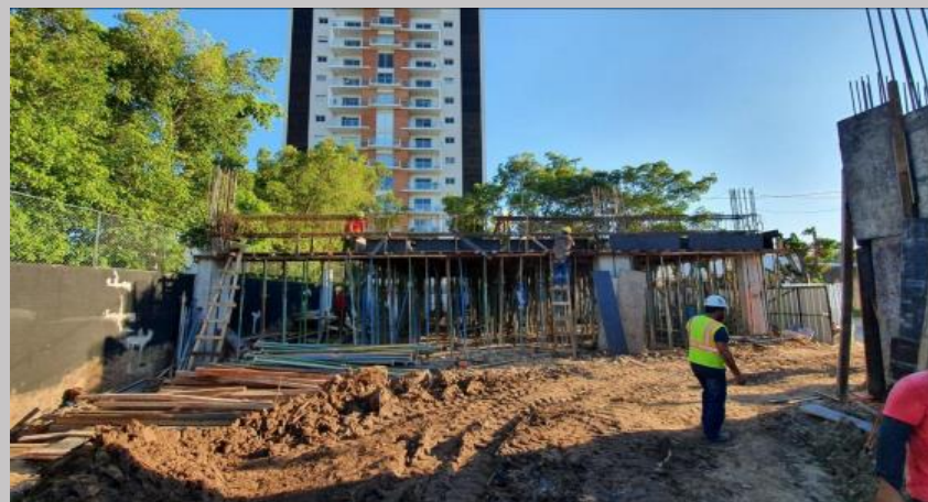
Una vista general del avance de esta primera etapa del encofrado