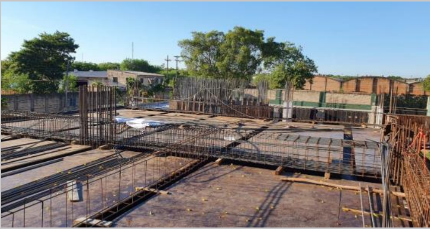
Avance del sector de encofrado