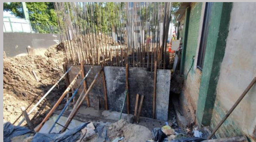
Encofrado de caja de escalera y ascensor en su tramo hasta PB