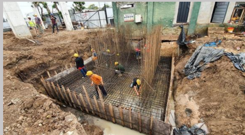
Fundación caja de escalera y ascensor