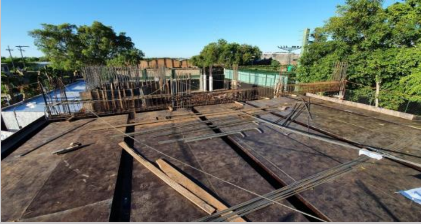
Fondos de losa de esta primera etapa de carga