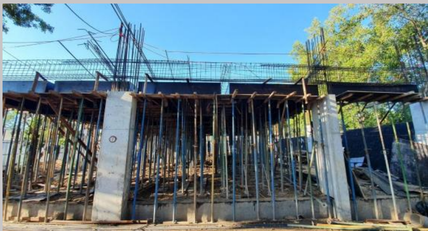
Trabajo actual y avance en el encofrado