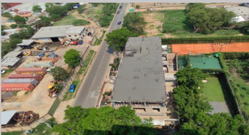
Losa del piso 3 totalmente hormigonada