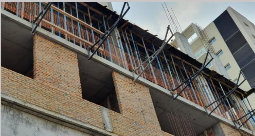
Vista del cerramiento y vanos de aberturas del piso 1