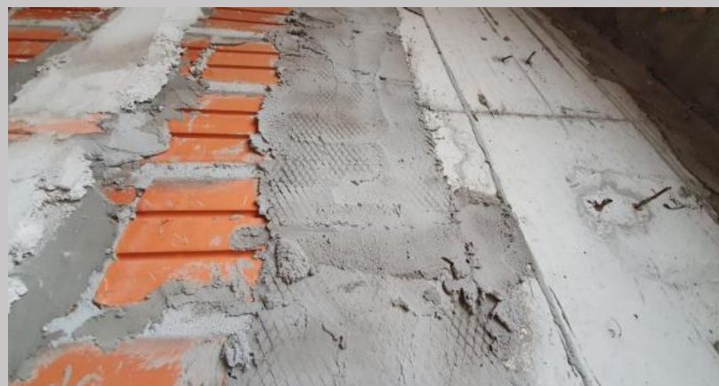
Puente de dilatación entre mamposterías y hormigón- colocación de tramafix