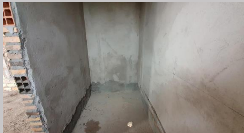
Revoque hidrófugo en zonas húmedas- baños y lavaderos