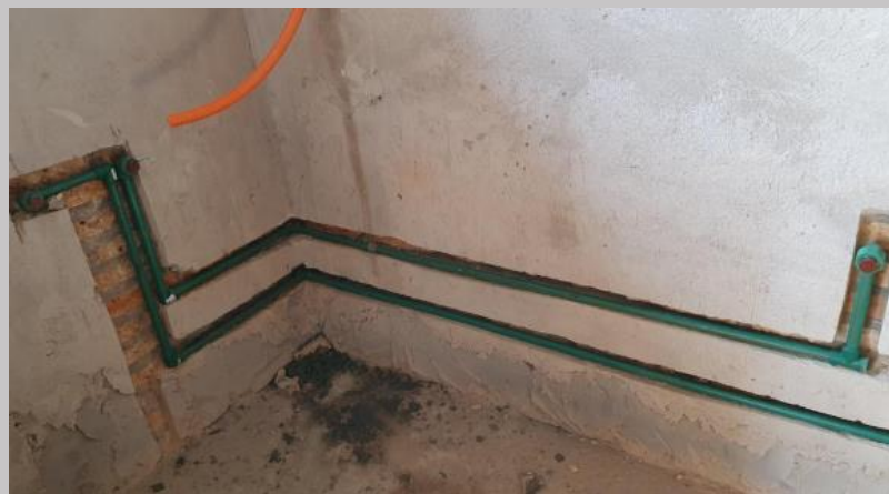
Cañería de agua por termofusion primer piso