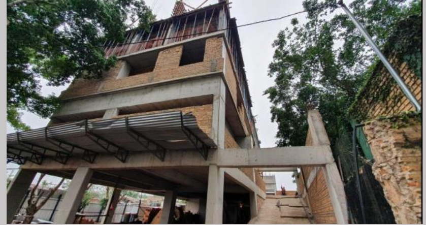
Vista actual desde otra perspectiva