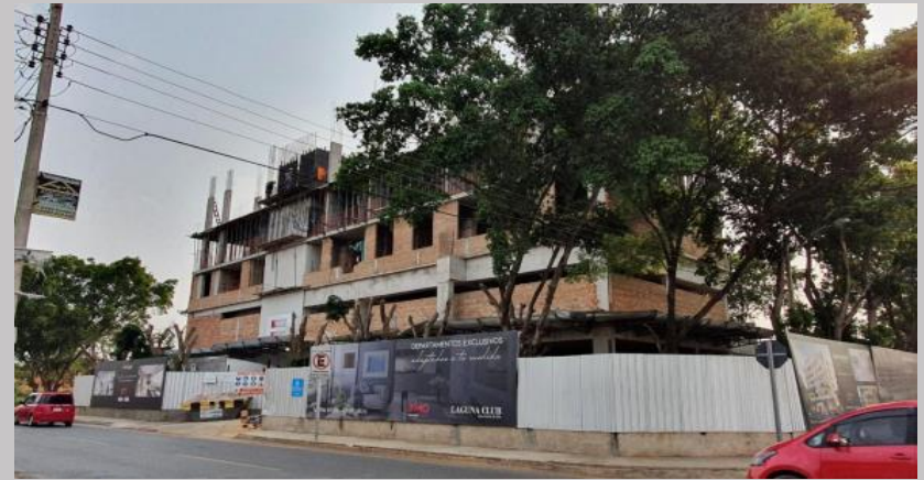
Avance actual desde esquina de la Av. Laguna Grande