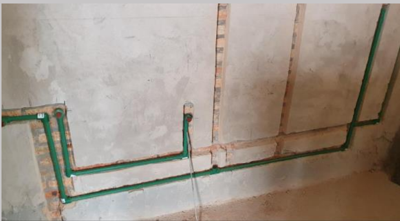
Ducteado en pared de la alimentación de agua fría y caliente en baños