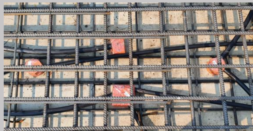
Electroductos y cajas en losa