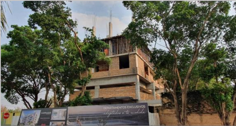
Avance actual vista desde edificio Trinity