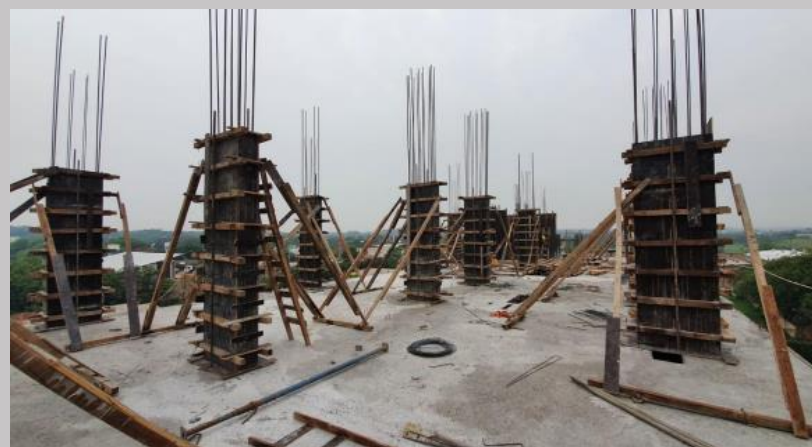
Avance en el encofrado, armaduras y hormigonado de pilares para la losa del piso 4