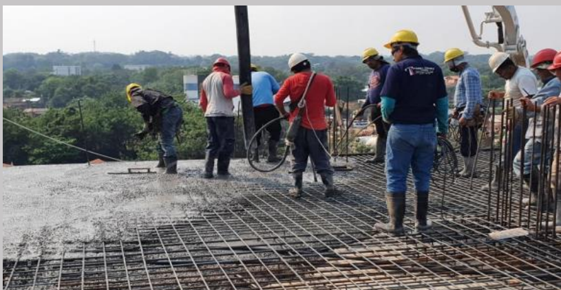
Avance del cargamento