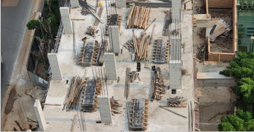
Pilares para el piso 4