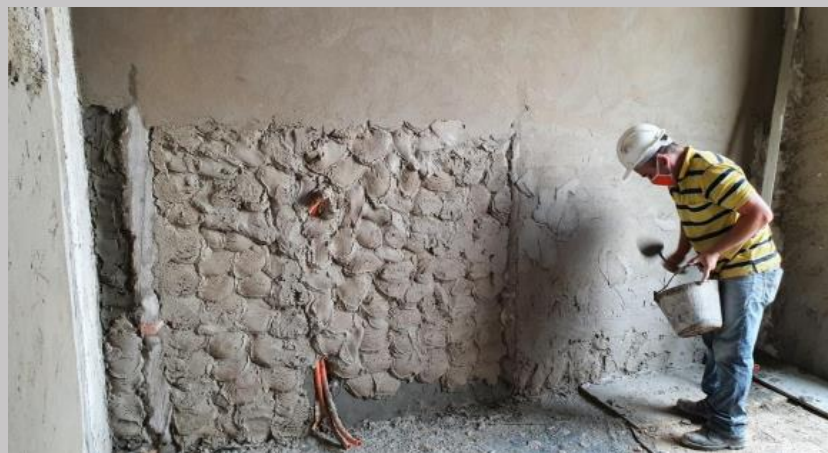
Revoque de paredes