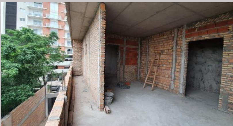
Cerramientos 0.15 piso 1