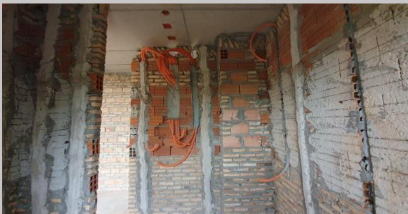
Electroductos y enfajado para revoque