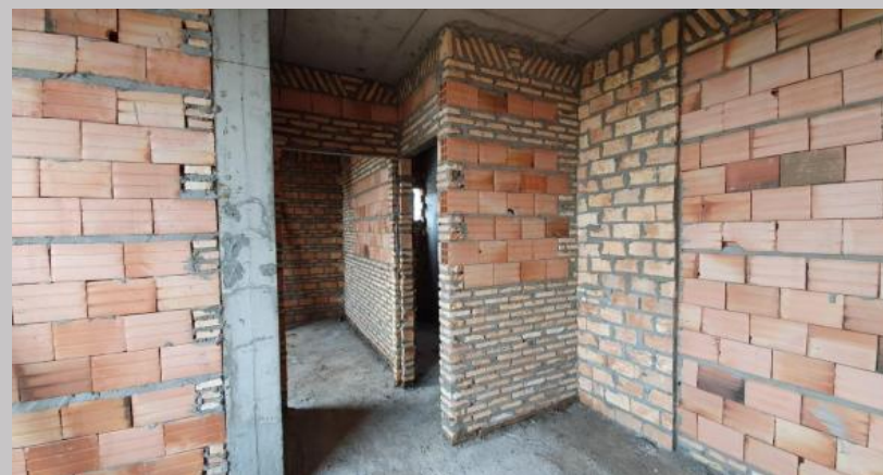
Mamposterías de cerramiento en departamento 1A