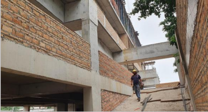
Mamposterías y parapetos en zona de rampa acceso a E1