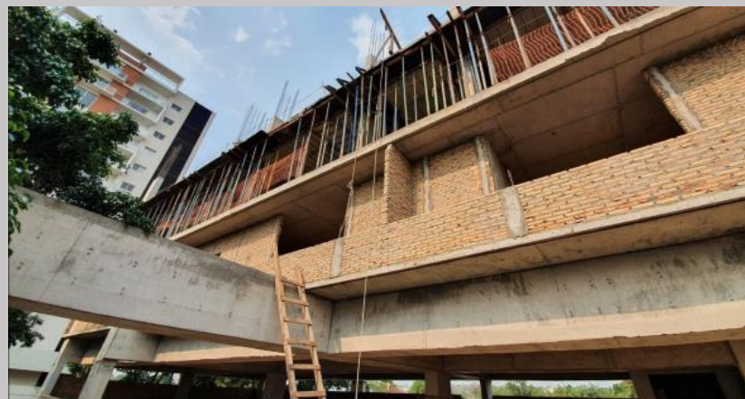
Cerramientos de mampostería en el primer piso