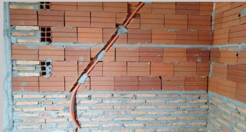
Electroductos en muros