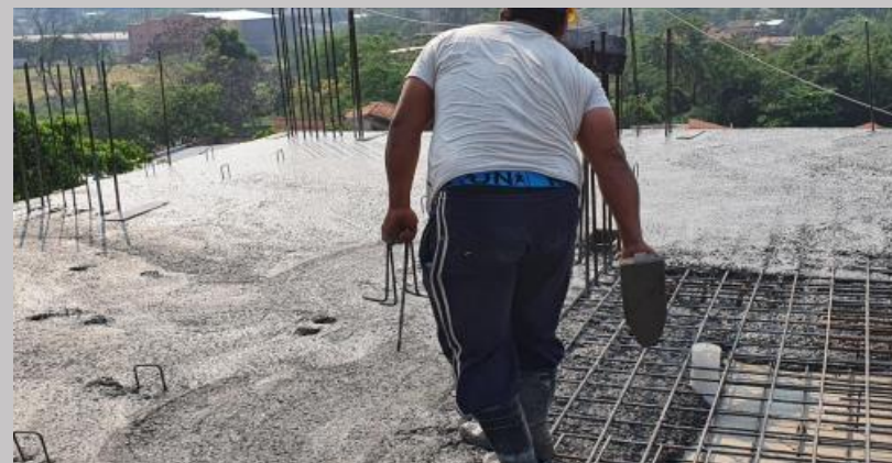
Hormigonado de la losa para el tercer piso de departamentos