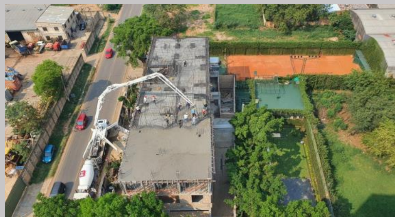
Una vista en altura del avance del hormigonado del piso 3