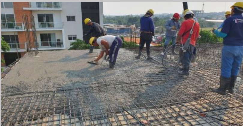
Jornada de hormigonado de la losa del piso 3