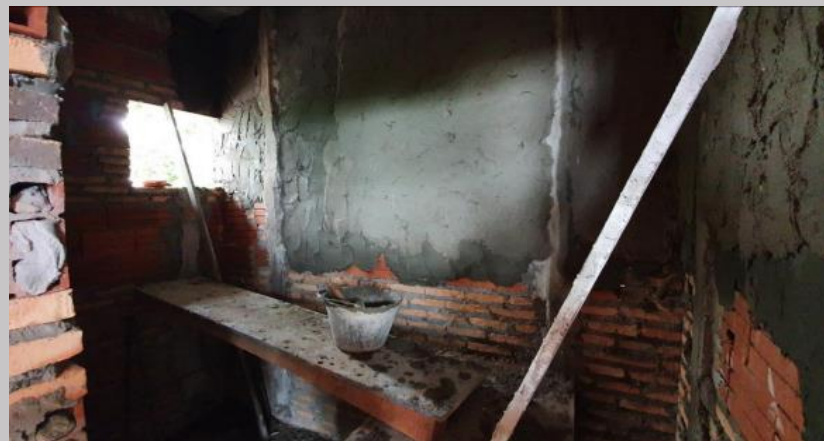
Avance del revoque en departamento 1E