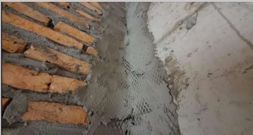
Colocación de tela trafiax para evitar fisuras entre mampostería y hormigón