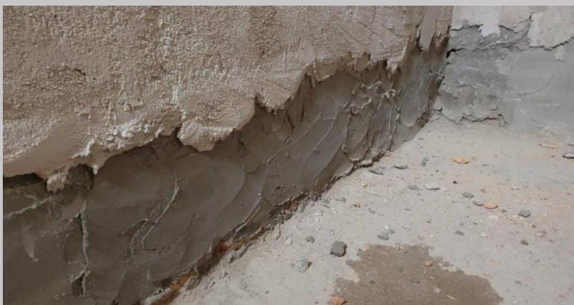
Babetas perimetrales en baños para enlace de la aislación del piso