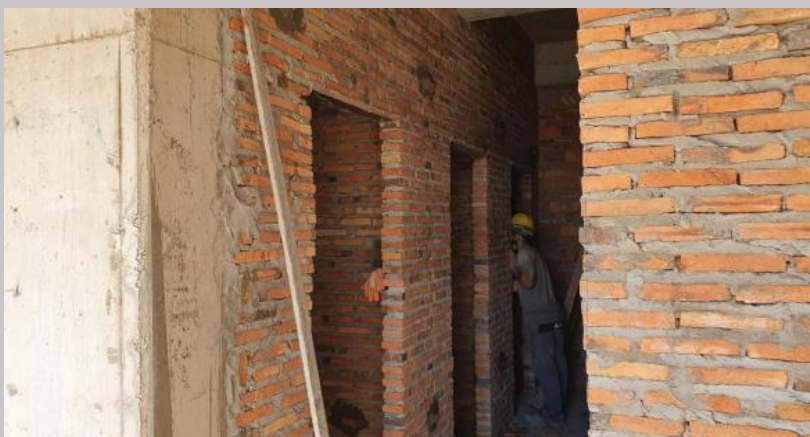
Sector de bauleras en E1