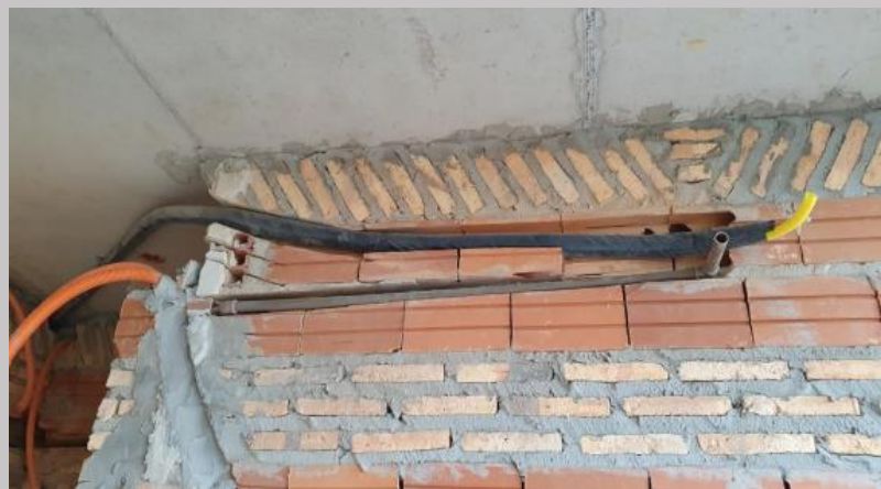
Tendido de los ductos de cobre forrados para AA piso 1