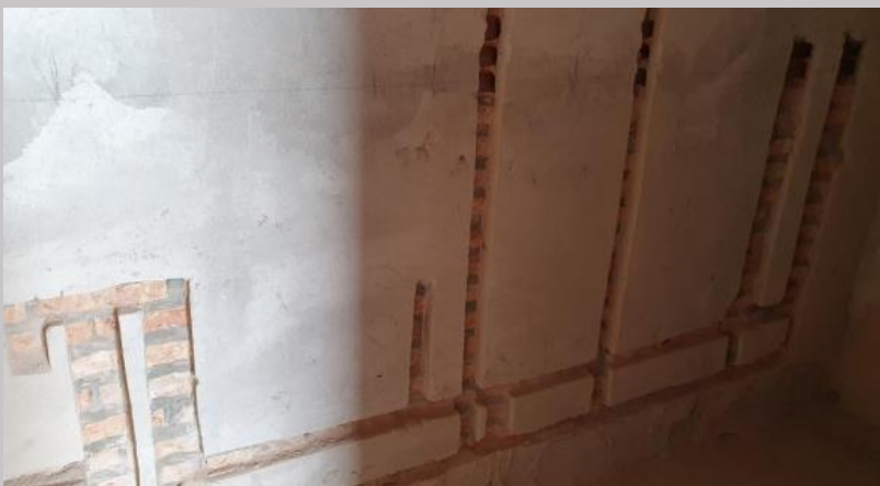
Replanteo para la alimentación hidráulica en baños del primer piso