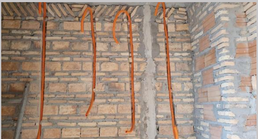
Tendido en muros de electroductos- piso 1