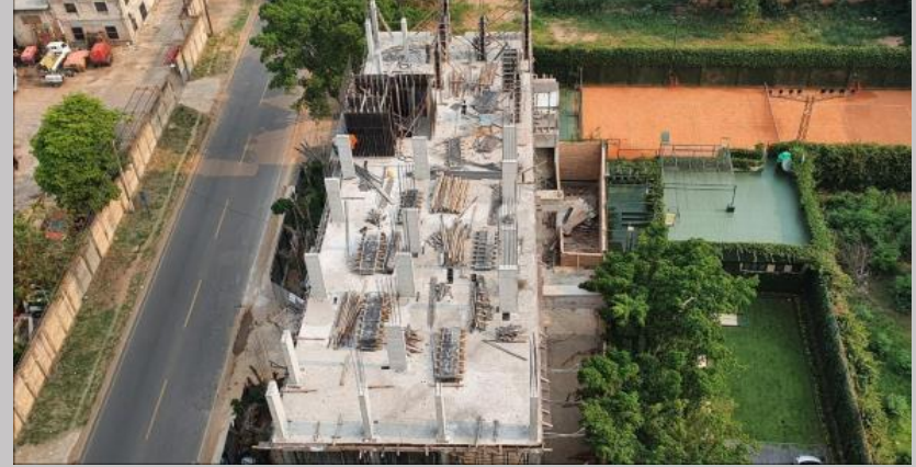
Avance actual de la estructura- preparacion para la losa del cuarto piso