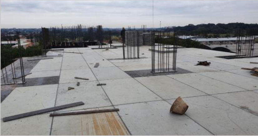
Encofrado de fondo de losa con estructura metálica