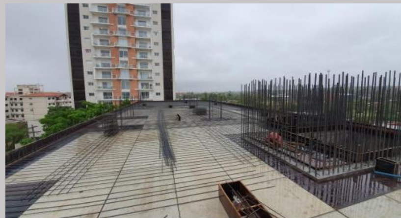
Colocacion actual de las armaduras inferiores