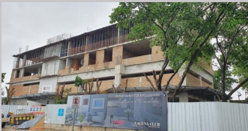
Vista actual del avance