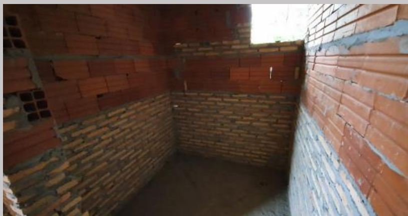
Mampostería en zona de baños hasta 1,10 con ladrillos comunes