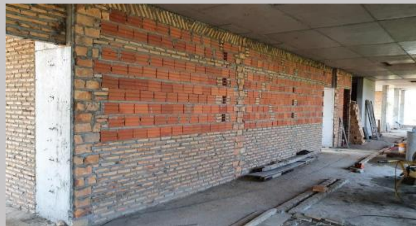
Cerramientos en el piso 1