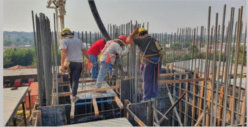
Jornada de hormigonado del tabique caja de escalera y ascensor