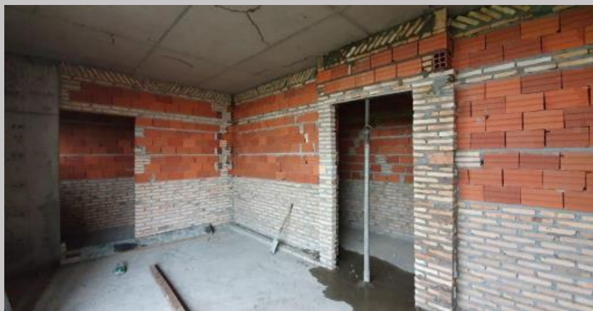
Primer 1,20 de altura con ladrillos comunes