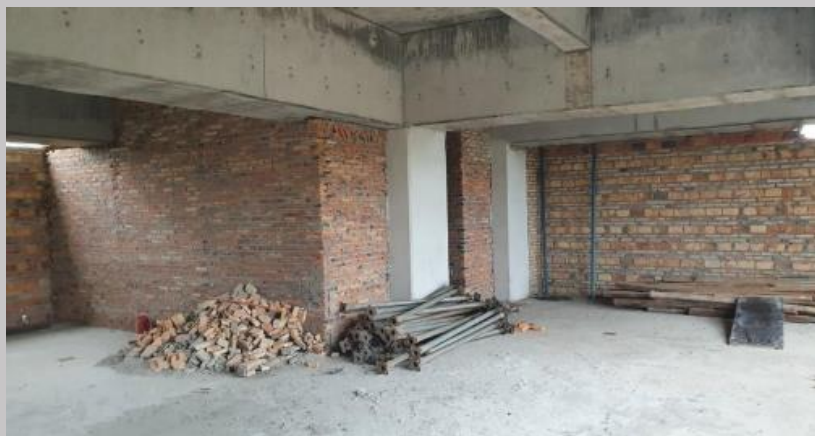
Cerramiento zona de bauleras del estacionamiento 1