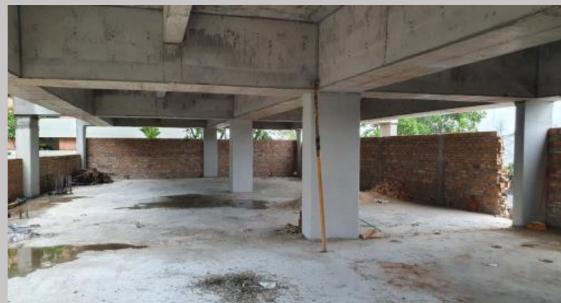
Cerramientos linderos en estacionamiento 1