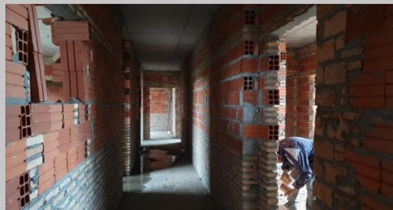
Vista del cerramiento actual desde el sector del palier piso 1