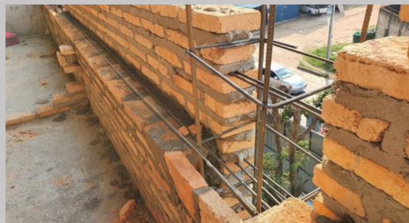
Rigidización de todas las paredes linderas con pilares e hiladas de varillas