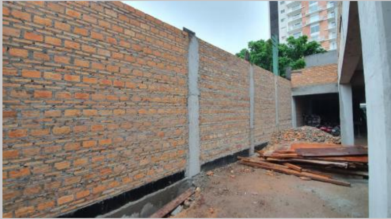
Mampostería en linderos de la planta baja