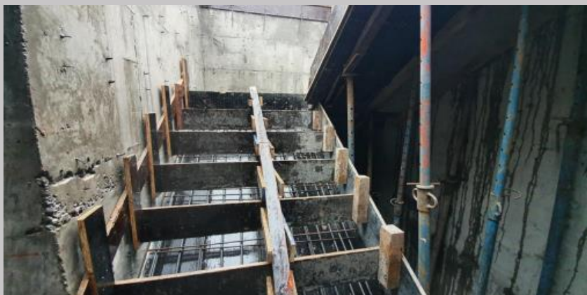
Avance en el encofrado y armaduras del tramo de escalera del piso 2 al 3