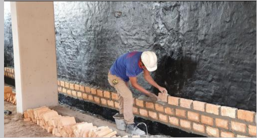
Tratamiento de aislación hacia los linderos en paredes de planta baja