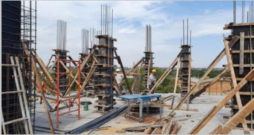
Pilares para la tercera losa de departamentos