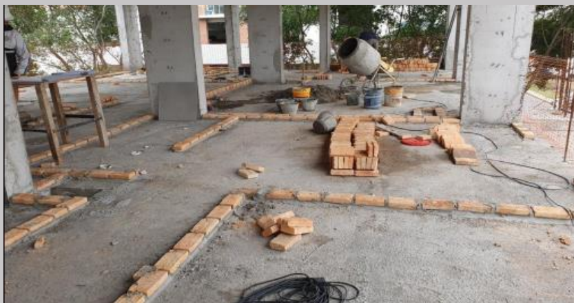
Trabajos iniciales de replanteo y marcación para la mampostería en el piso 1