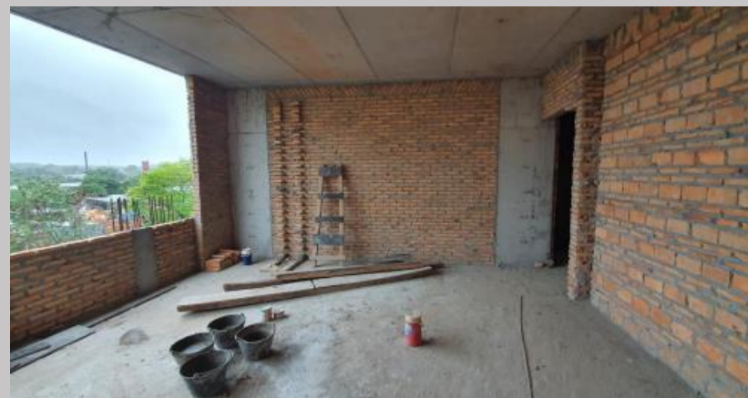
Avance del cerramiento de los ambientes en el piso 1