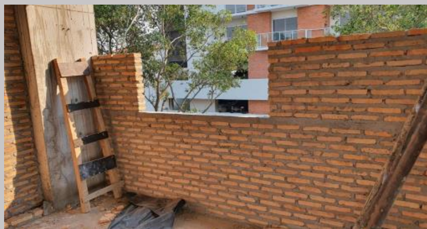
Cerramientos linderos en zona de aberturas con rigidización en el antepecho