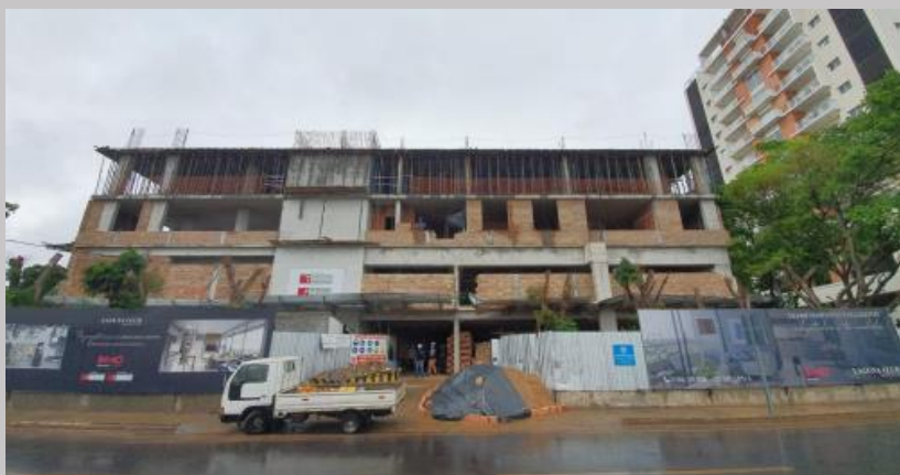
Vista del avance en su fachada desde la Avenida