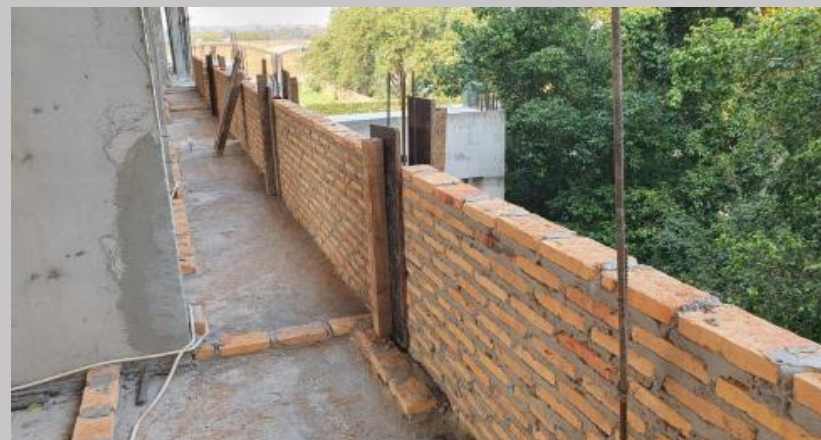
Elevación de las paredes en linderos rigidizadas con pilares de hormigón