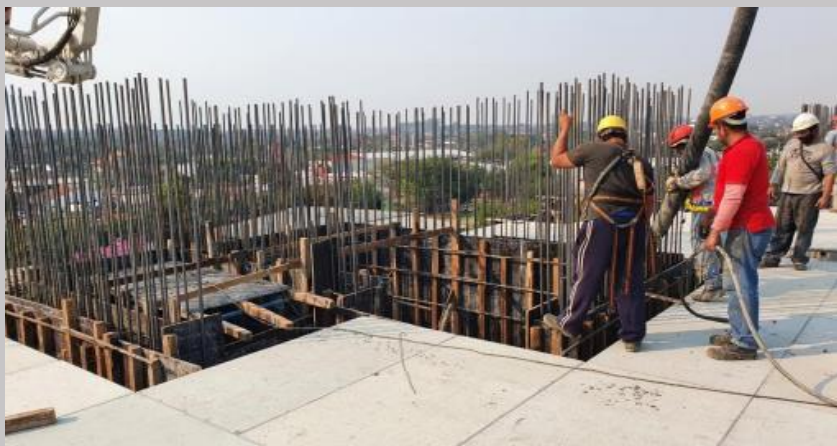
Hormigonado del tabique hasta el nivel de asiento de la losa piso 3