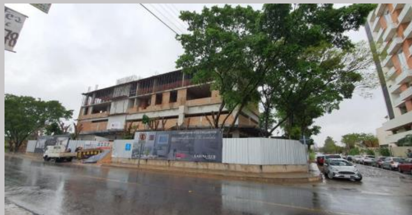
Otra vista actual desde otra perspectiva