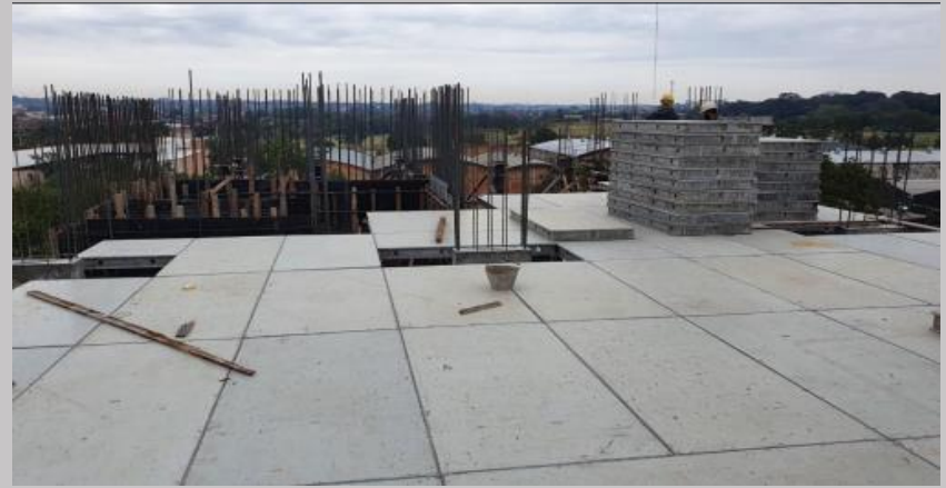
Encofrado para la losa del piso 3