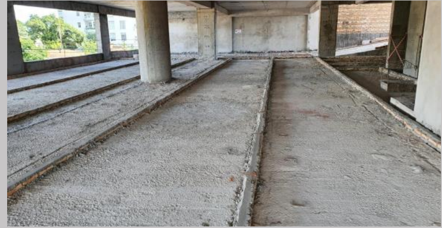
Colocación de las fajas