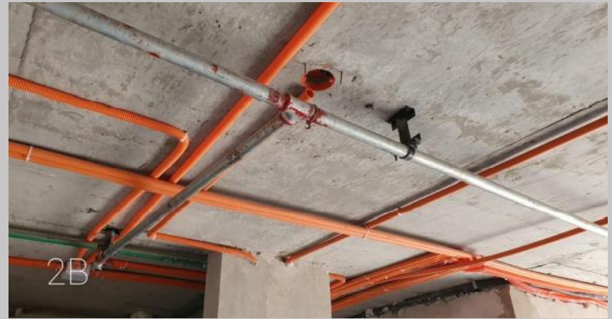
Ductos eléctricos y PCI sobre losa techo del 2B