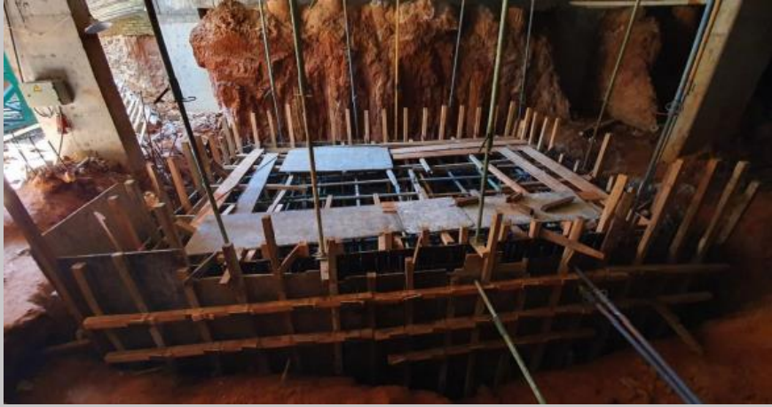
Vista actual del encofrado y armaduras de las paredes en espera del hormigonado