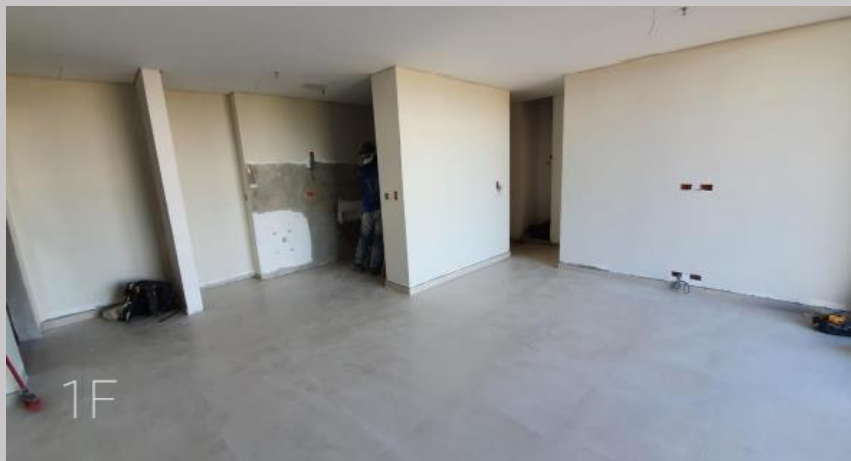
Vista actual del dpto. 1F