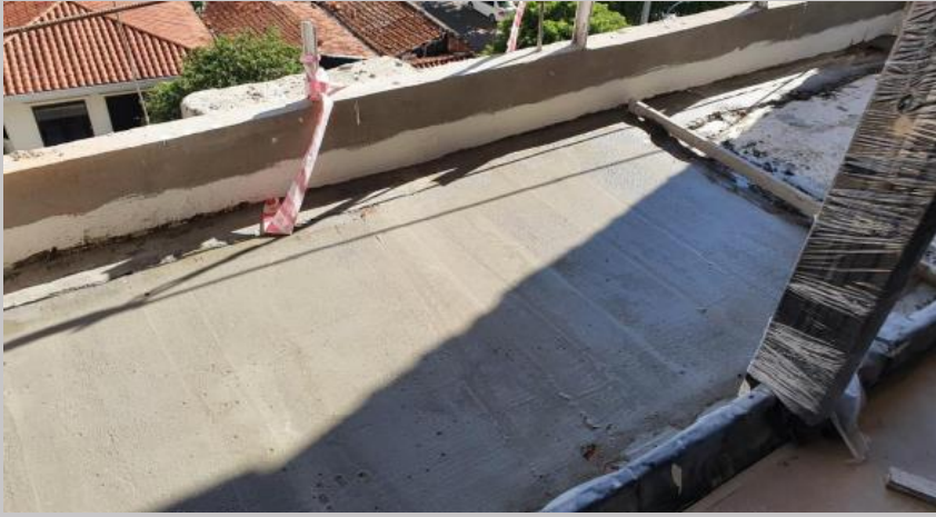
Carpeta hidrófuga en balcones del piso 1