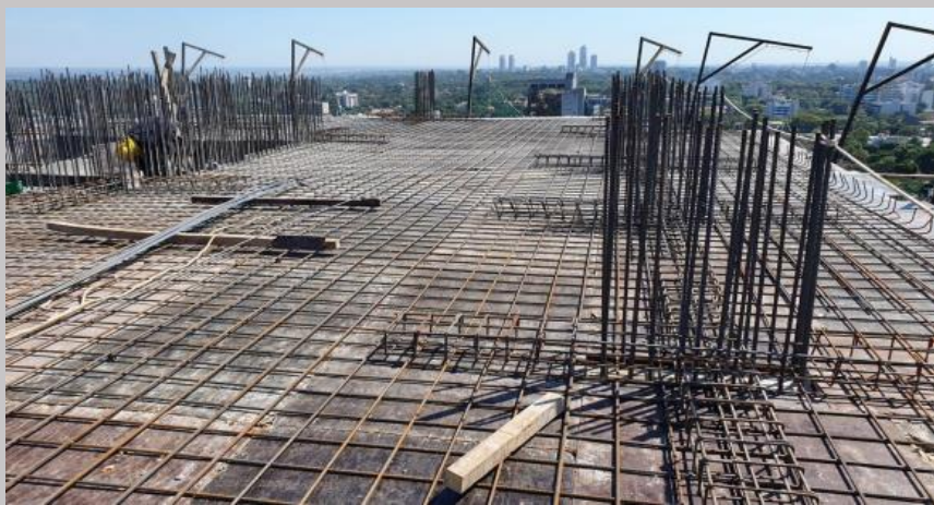
Avance en el encofrado y armaduras para la losa del piso 11