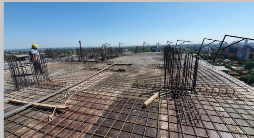
Vista actual de la losa para el piso 11 a ser hormigonada