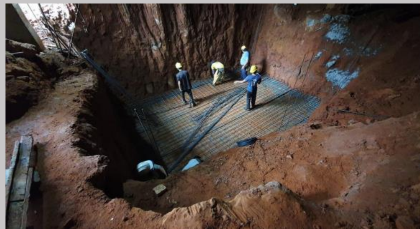
Preparación de la losa fondo del tanque en el sub suelo