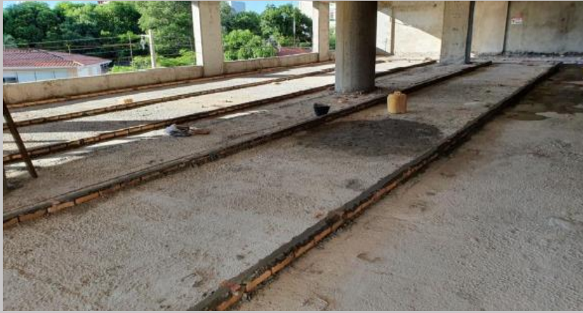
Trabajo de colocación de las fajas guías en E2