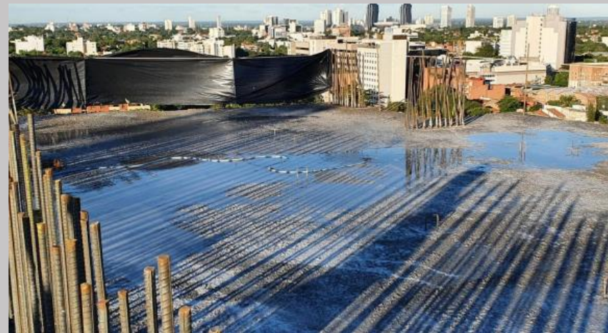
Sectores ya terminado