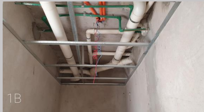
Estructura para cielorraso para placas hidrófugas en baño del 1B