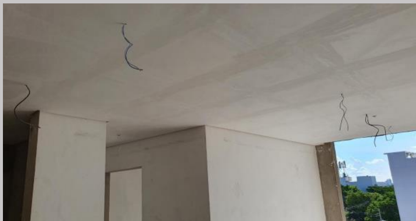
Colocación de cielorraso en el primer piso