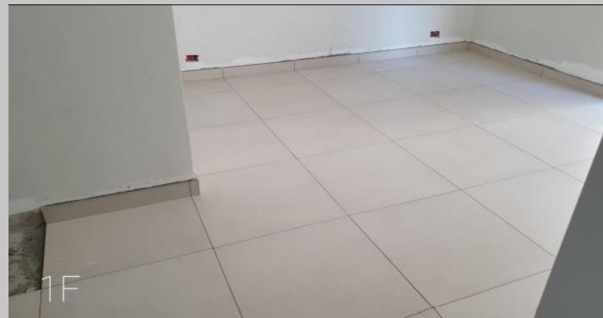
Colocación de piso en el 1F