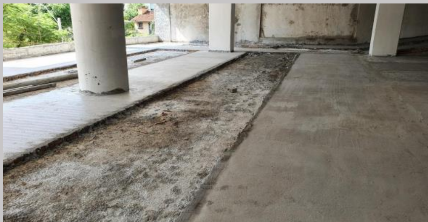
Carga en el nivel E3