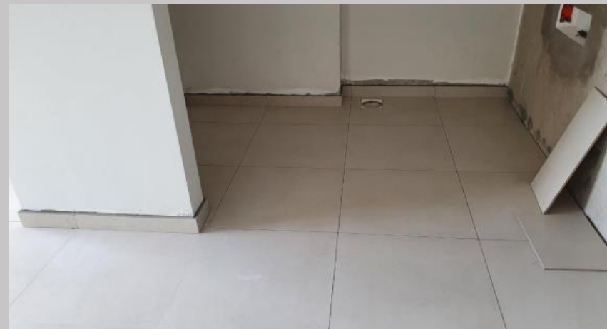
Piso en el 1C