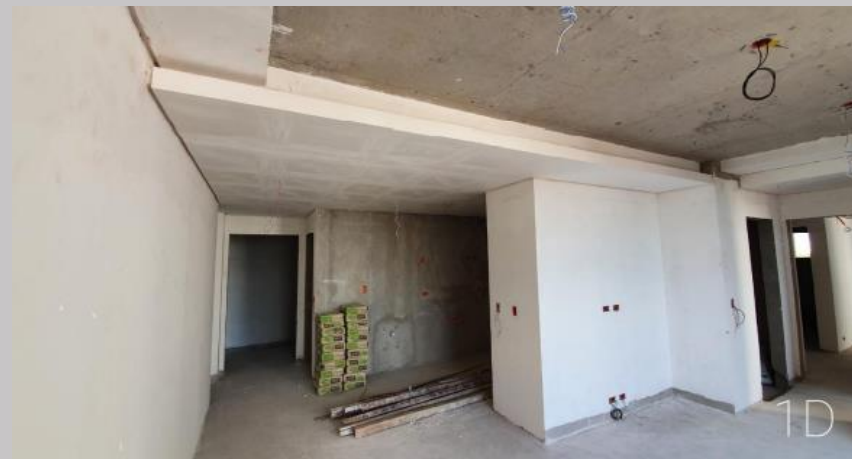
Cielorraso en el 1D