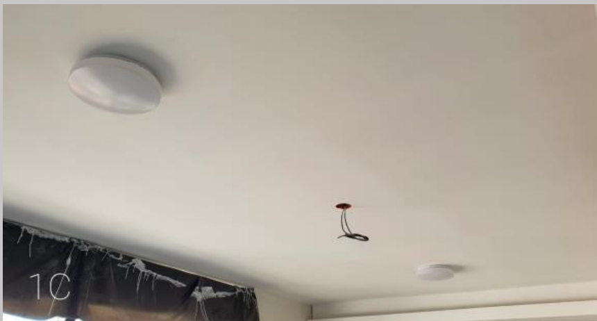
Montaje de artefactos de iluminación en el 1C