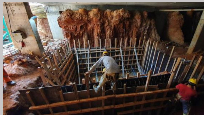
Trabajo de encofrado de las paredes