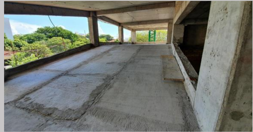
Trabajo en los sectores de las rampas de acceso