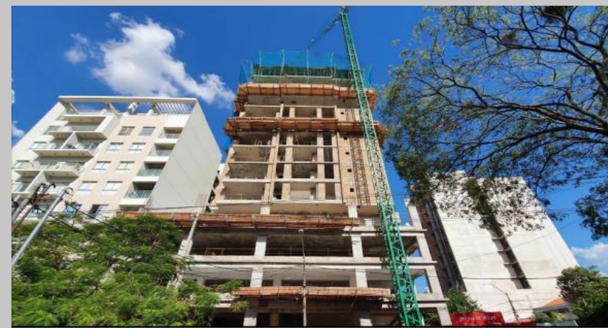
Una vista actual del avance de la fachada principal sobre Torreani Viera