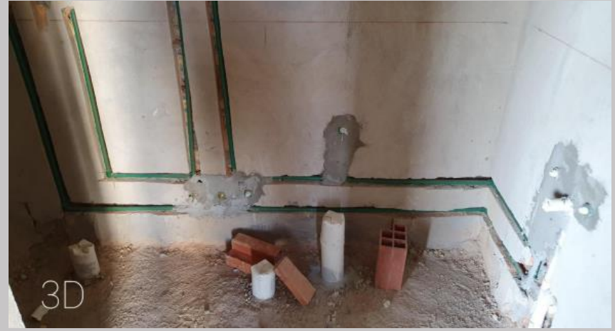
Alimentación de agua baño del 3D