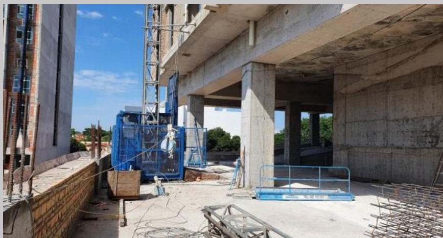
Montacargas ubicado en E3