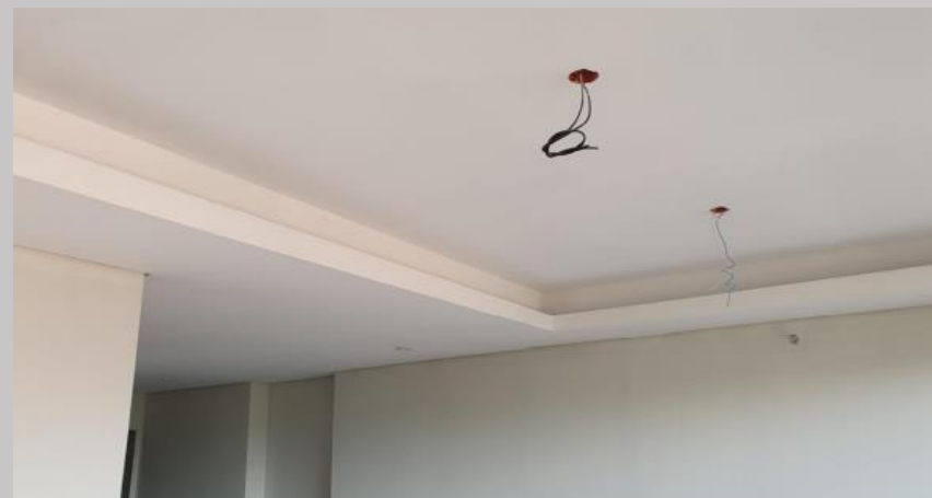
Cielorraso en el 1C