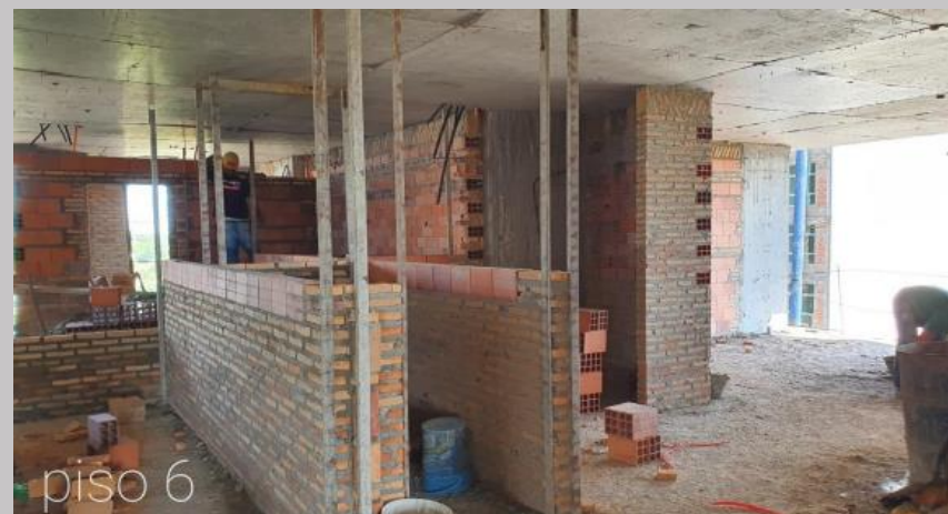
Cerramientos de mamposterías en el piso 6