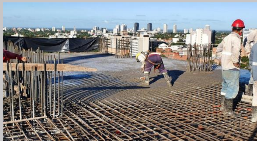
Terminado algunos sectores de losa