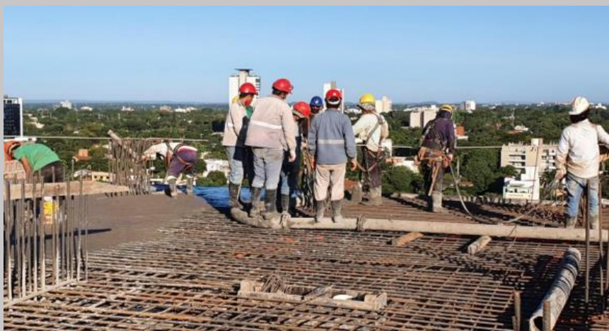
Avance del hormigonado