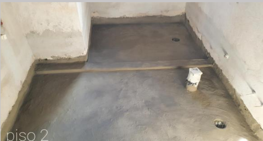
Aislación de losas de baños en el piso 2