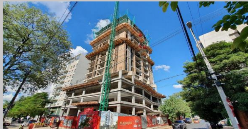
Vista del avance desde esquina de Pacheco y T. Viera