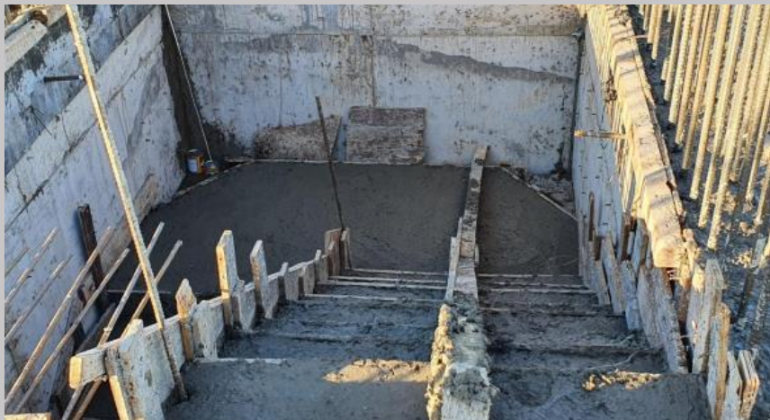
Hormigonado del tramo de escalera del piso 9 al 10