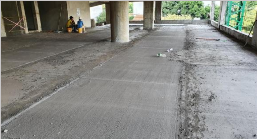
Carga del contrapiso y alisada de terminación