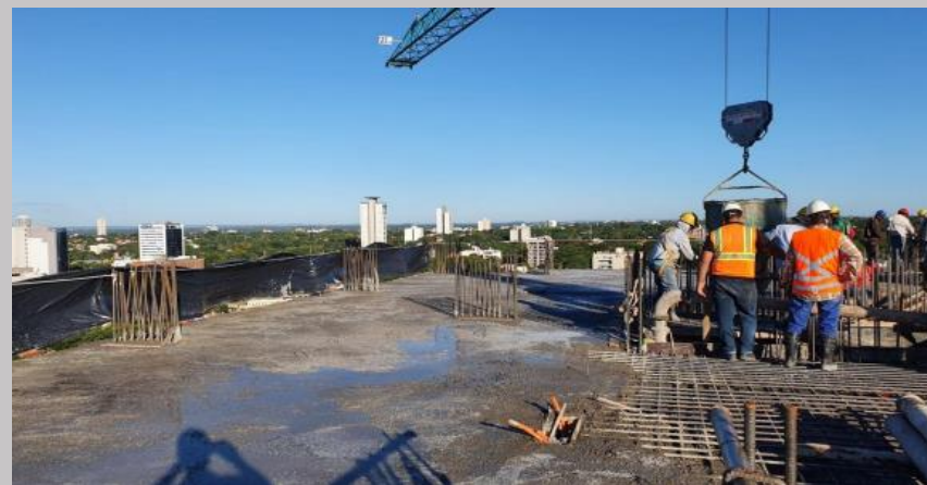
Jornada de cargamento del piso 10