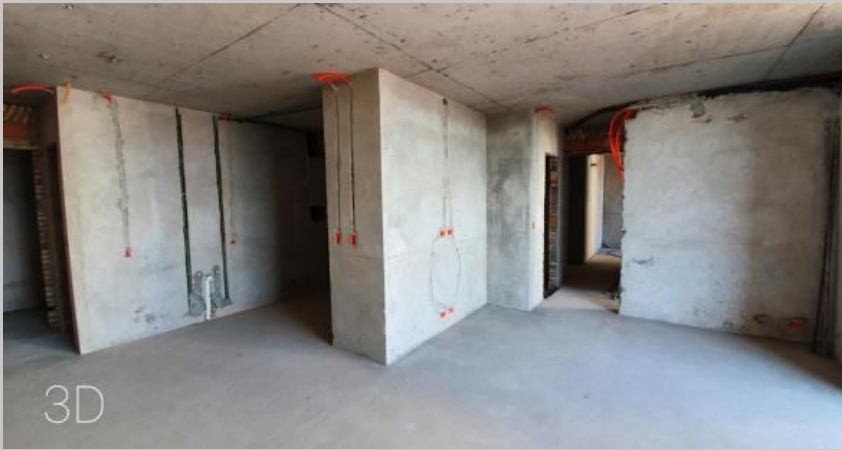
Revoque, carpeta e instalaciones en el 3D