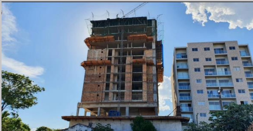
Vista actual de la fachada posterior