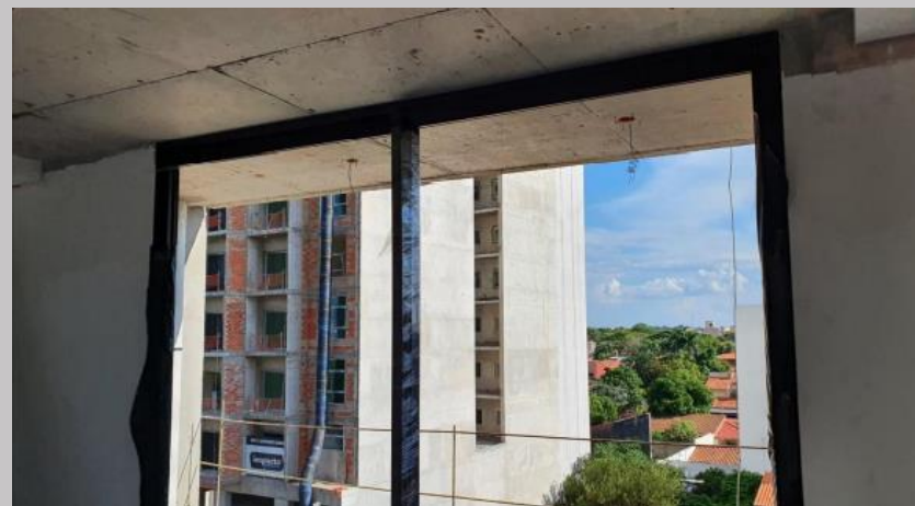
Marcos de aluminio en aberturas del piso 1