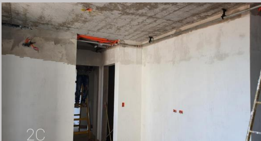
Enduido primera mano en el 2C