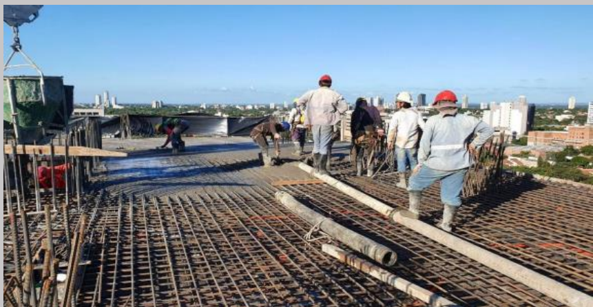
Inicio del hormigonado de la losa del piso 10