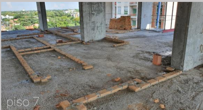
Replanteo para los cerramientos en el piso 7