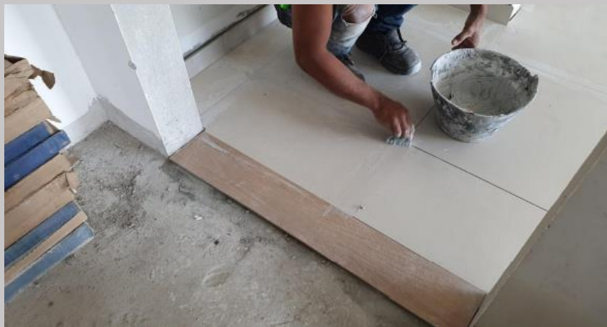
Pastinado y umbral en el primer piso