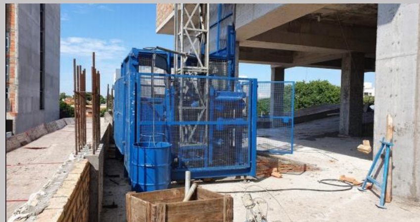
Montacargas y personal ya en pleno funcionamiento