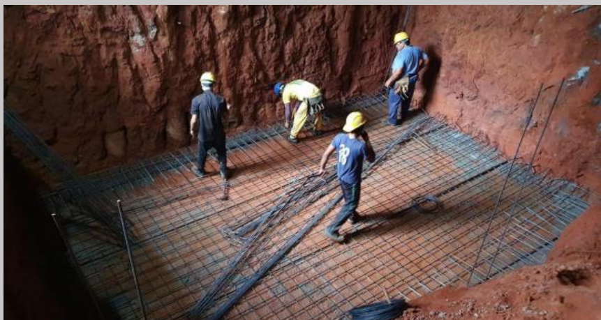
Preparación de las armaduras para la losa del tanque de agua inferior