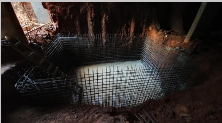
Armatura de los tabiques laterales del tanque